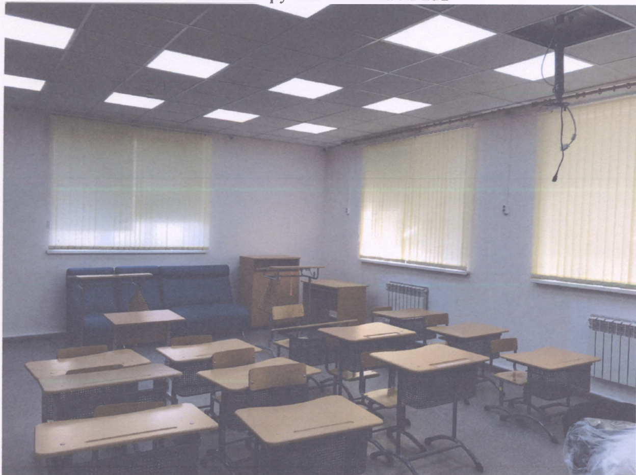
Кабинет социально-бытовой ориентировки № 224