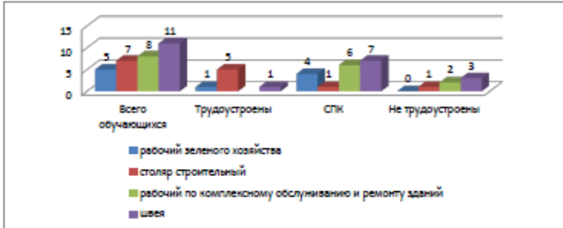
Рисунок 6. Мониторинг жизненного определения выпускников 11-х классов, 2022 год (чел.)