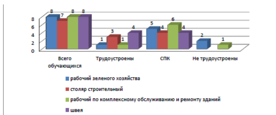
Рисунок 6. Мониторинг жизненного определения выпускников 11-12-х классов 2021 год (чел.)